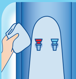
Vòi lạnh / nóng