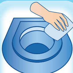
Mặt bên trên ngoài máy