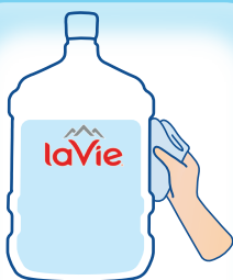
Bình nước 5G